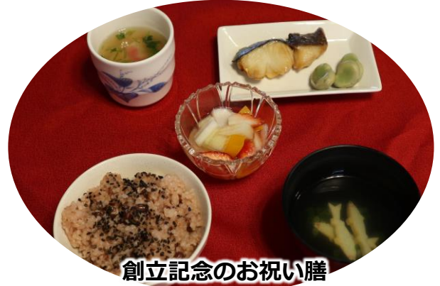
創立記念のお祝い膳

毎年、5月16日は園の創立記念日として、ささやかですがお祝い膳を提供させていただいています。この日のメニューは、お赤飯、銀ダラ照り焼き、はす蒸し、澄まし汁、フルーツでした。入居者の皆様と、喜びを共有することができ、楽しい時間になりました。